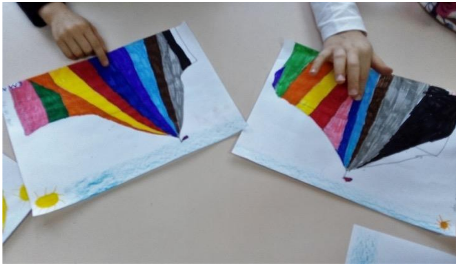
Colours and finally...