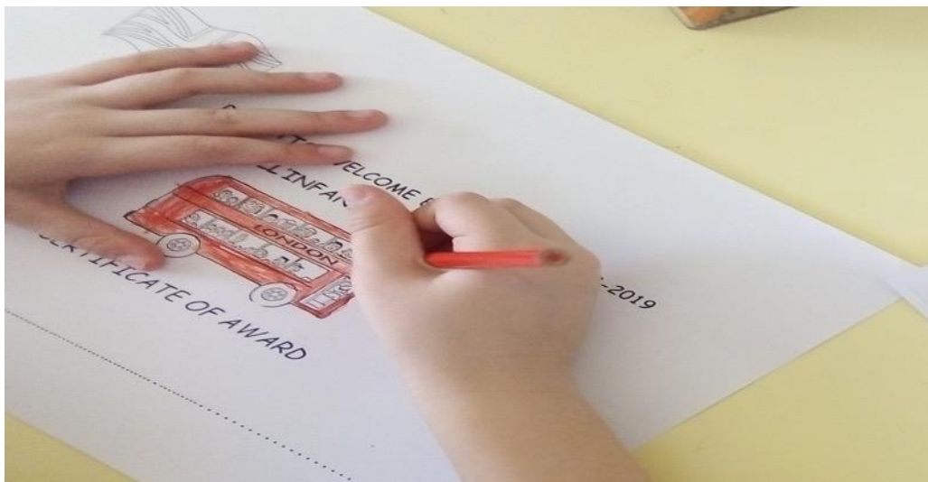
My certificate of award YEAH 😊