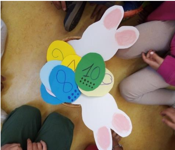
Happy Easter...Bunny and...numbers