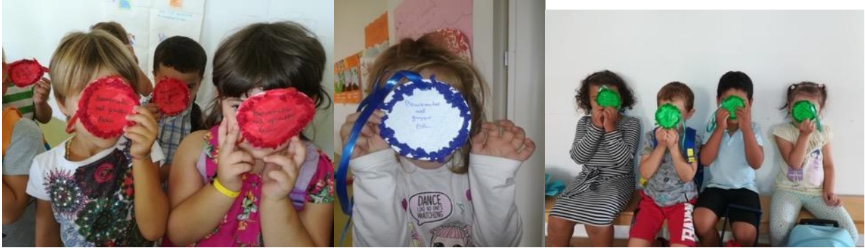
REALIZZAZIONE DELLA BOLLA – COLLANA RELATIVA AL GRUPPO DI APPARTENENZA

NUOVE REGOLE Quest'anno sarà un anno particolare, ci saranno nuove regole da rispettare: dovremo mantenere la distanza in ogni momento e circostanza, dovremo lavarci spesso le mani con molta cura per un'igiene più sicura. Tutti ci dobbiamo impegnare così ci possiamo salvaguardare! Se assieme ci impegneremo...Questo virus sconfiggeremo!!!