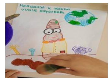
REALIZZAZIONE DELLA SETTIMANA DI ORESTE