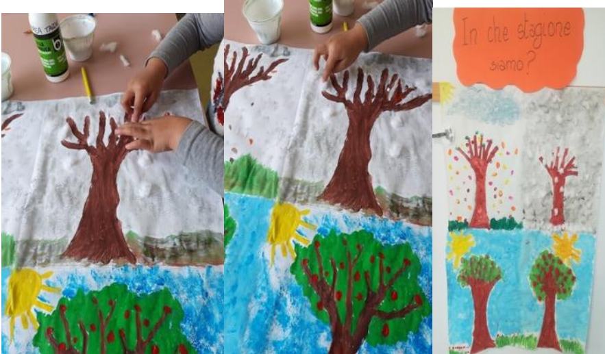
REALIZZAZIONE DEL CALENDARIO DEL TEMPO E DELLE STAGIONI