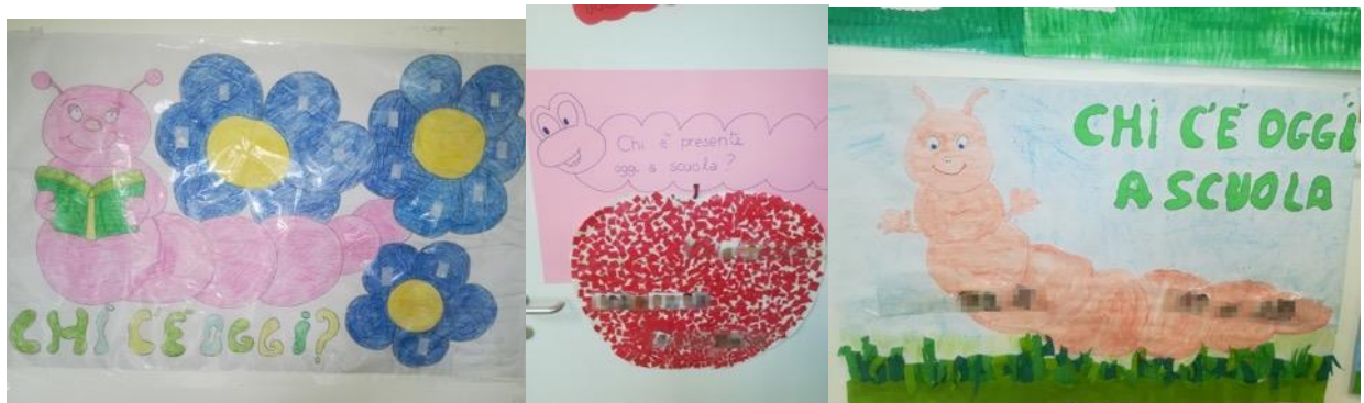
REALIZZAZIONE DEL CALENDARIO DELLE PRESENZE