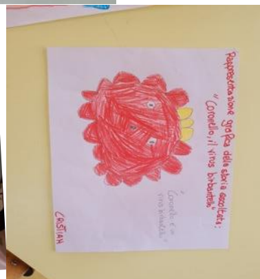
ASCOLTO E RAPPRESENTAZIONE DELLA STORIA DI "CORONELLO, IL VIRUS BIRBANTELLO" E REALIZZAZIONE DEL CARTELLONE CON LE REGOLE ANTICOVID